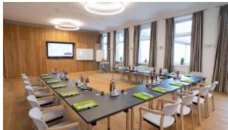
Kneipp Salon U-Form