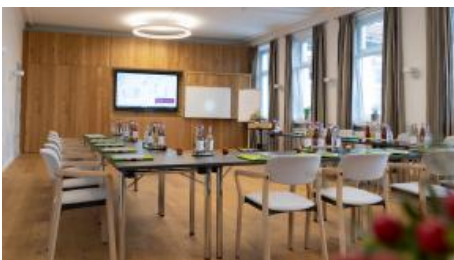
Kneipp Salon U-Form