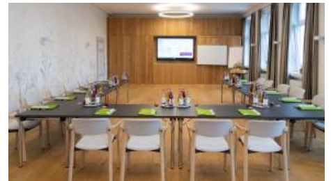
Kneipp Salon U-Form