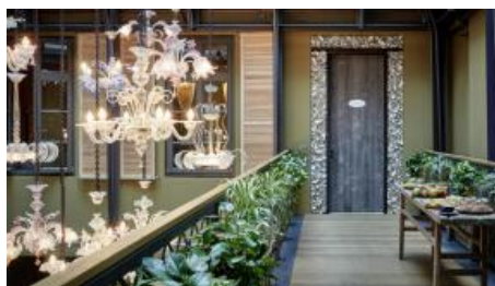
Brücke zur Muschelkammer