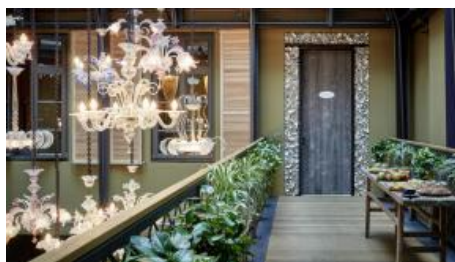
Brücke zur Muschelkammer