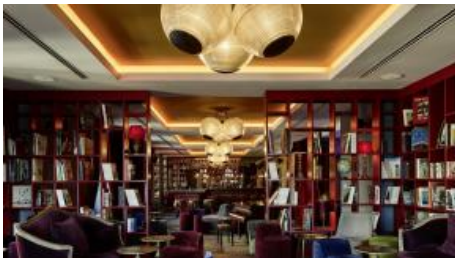
Boilerman Bar % Bibliothek