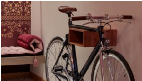
Fahrrad im Extra Large Zimmer