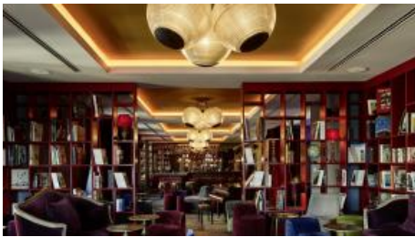
Boilerman Bar % Bibliothek