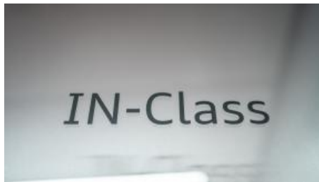
IN-Class - Workshops und Präsentationen