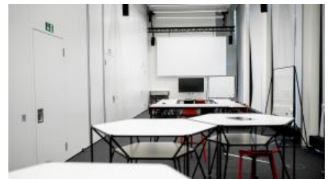
Collaborat-IN' Area 1