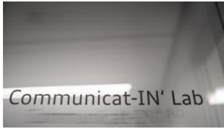
Communicat-IN' Lab - Kommunikation und Diskussion