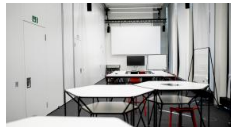
Collaborat-IN' Area 1