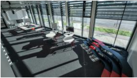
Collaborat-IN' Area 1 & 2 offen