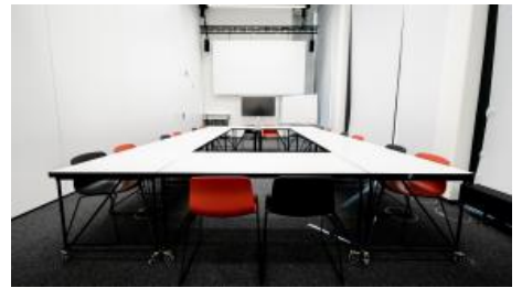
Collaborat-IN' Area 2