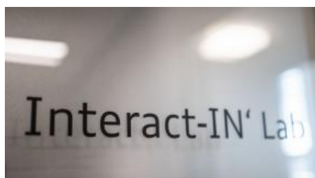
Interact-IN' Lab - Interaktion und Ideenfindung