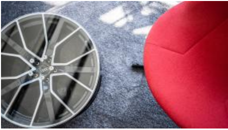
AES IN conference