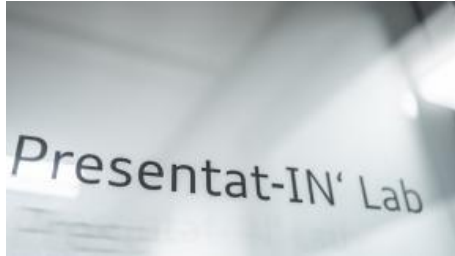
Presentat-IN' Lab - Präsentation und Auswertung