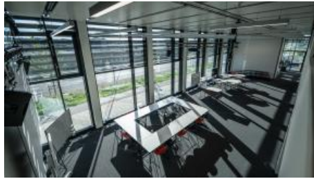
Collaborat-IN' Area 1 & 2 offen