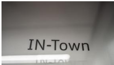
IN-Town - Besprechungen mit Lounge-Charakter