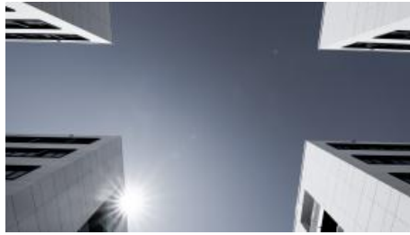
Projekthaus am incampus