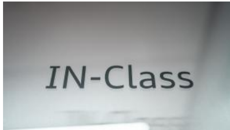
IN-Class - Workshops und Präsentationen