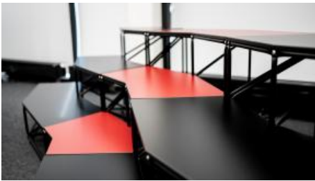
Collaborat-IN' Area 1