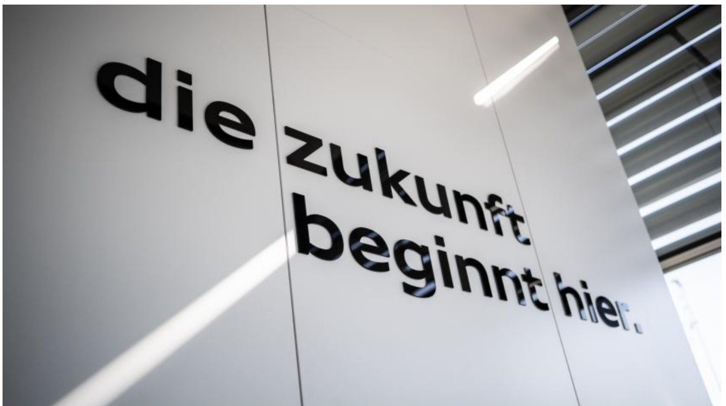
Projekthaus am incampus

Gerne stehen wir Ihnen auch persönlich für eine individuelle Beratung oder Besichtigung vor Ort zur Verfügung. Wir freuen uns auf Ihre Anfrage!