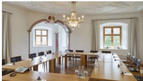
klassischer Tagungsraum (Beispielbild)