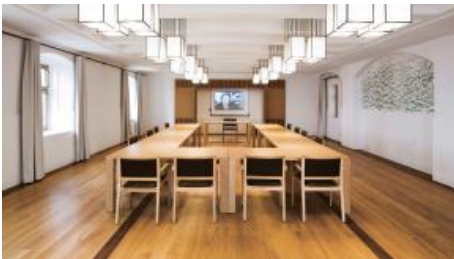
klassischer Tagungsraum (Beispielbild)