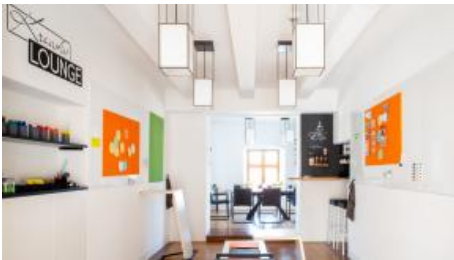
Turm der Ideen