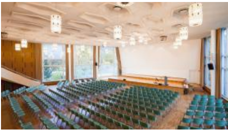
Konzertsaal Richard Strauss