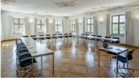
Musiksaal, Tagungsraum im 2.Stock mit Seeblick