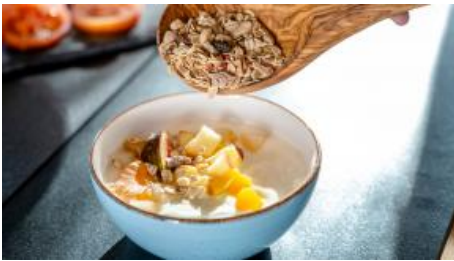
Müsli mit frischem Obst