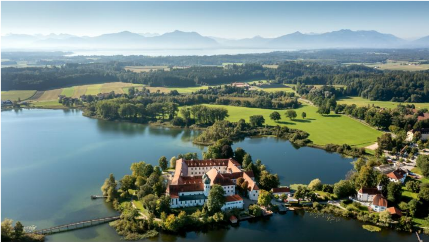
Kloster Seon Luftbild