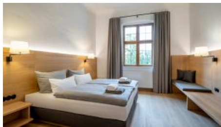
Doppelzimmer Kloster Seon