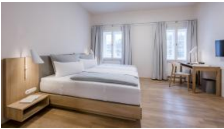
Hotelzimmer im Kramerhaus