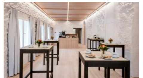
Kaffeepausenbereich im Kramerhaus