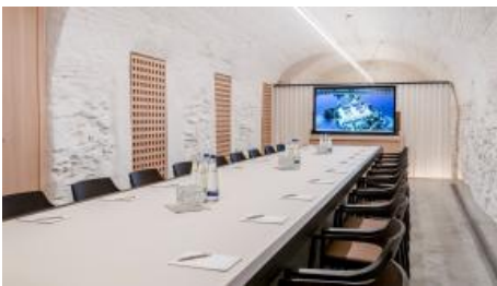
Der Tagungsraum im Kramerhaus