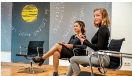
Tagung in unserem Saal Romanus