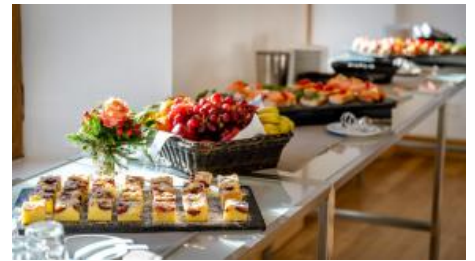
Kaffeepausenbereich mit Häppchen