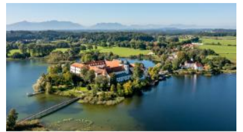
Kloster Seon Luftbild