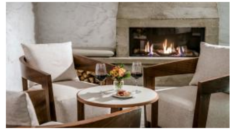
Das Kaminzimmer im Kramerhaus