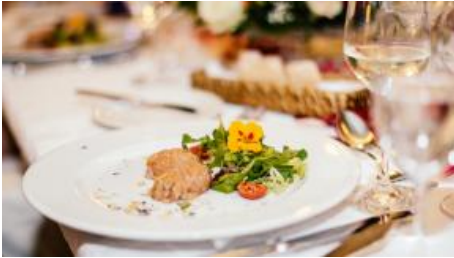
Hochzeitsdinner im Alm-Chalet