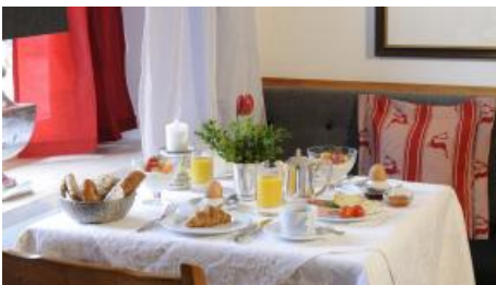
Frühstück im Restaurant Schlemmerei