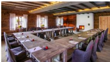
Seminar- und Veranstaltungsraum Alm-Chalet