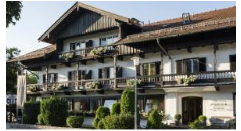
Außenansicht Relais-Chalet Wilhelmy