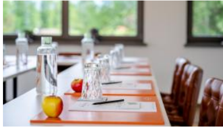
Tagen im Freigeist