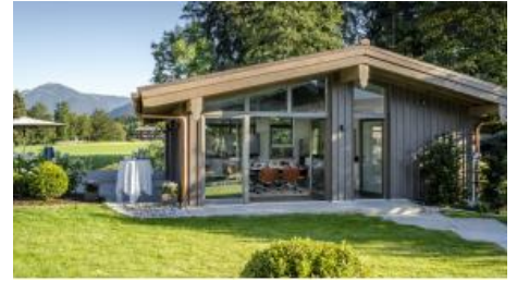
Tagen im Freigeist