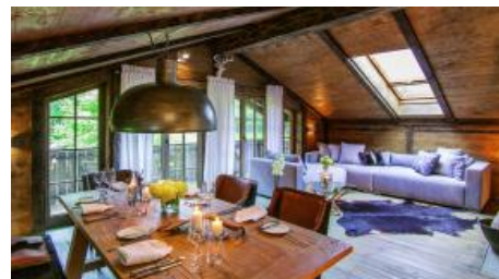
Alm-Suite im Alm-Chalet