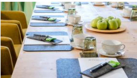
Seminarraum Halali Detailansicht