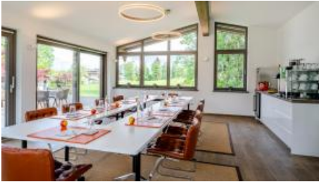
Freistehender Tagungspavillon Freigeist