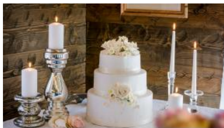
Hochzeitstorte im Alm-Chalet