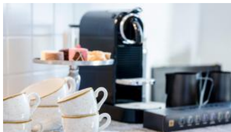
Kaffeepause im Seminarraum Halali