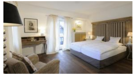
Suite im Haupthaus