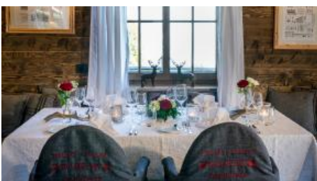
Festliche Tafel im Alm-Chalet