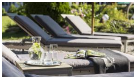
Nach der Sauna im Sommer