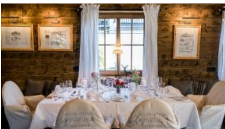
Hochzeitstafel im Alm-Chalet