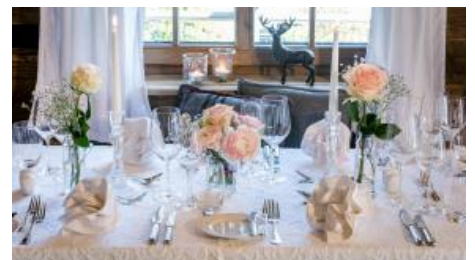
Festliche Tafel im Alm-Chalet