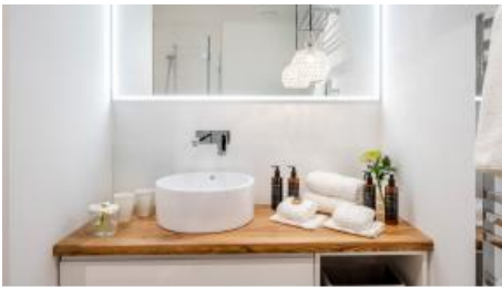
Badezimmer Natur Doppelzimmer