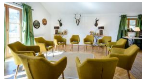
Sesselkreis im Seminarraum Halali