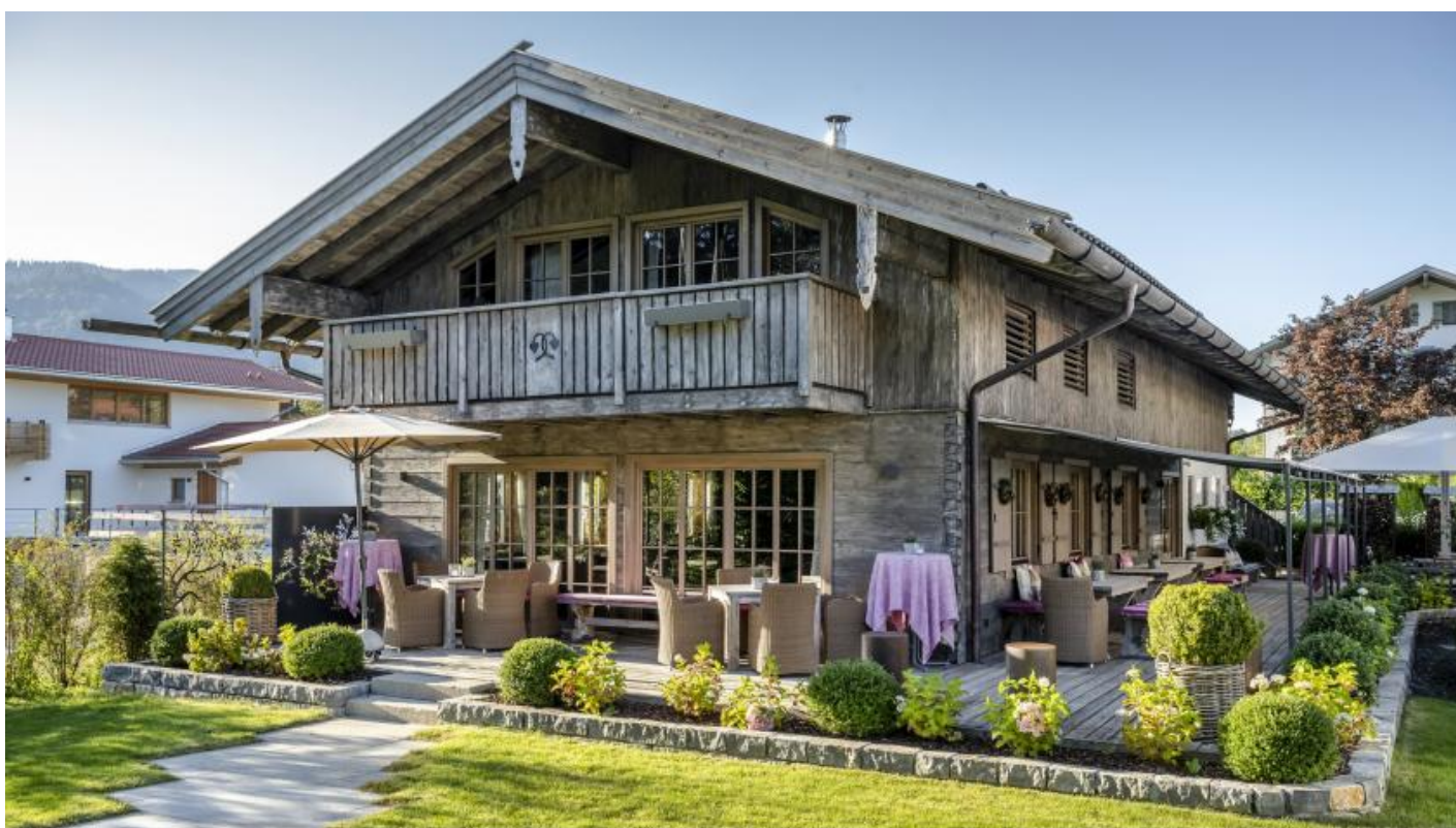
Seminar- und Veranstaltungsraum Alm-Chalet